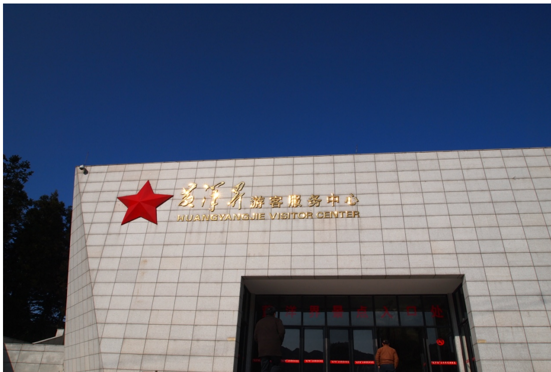
圖三：圖中所示為井岡山黃洋界遊客服務中心

區初創階段( 1978 – 1990 年 )、穩步發展階段 (1991 – 2000 年)，目前已進入了快速發展階段 ( 2000 年後 )。產業型態也從最初的「政治接待型」過渡到「一般產業型」，並最後發展成目前的「支柱產業型」。在 2008 年，年井岡山接待了 370 萬人次遊客，其旅遊總收入 26 億元，分別比 2005 年增長 70%和 136%。而在井岡山從事旅遊業的直接從業員有 3.5 萬人，佔全市人口的 22%，以旅遊為主的第三產業佔全市 GDP 的 51%，旅遊對財政的貢獻率為 64%，由此可見井岡山的旅遊業對當地經濟發展十分重要 (鐘&宋, 2010)。井岡山風景區的自然景觀優美、生態環境優良、生態旅遊已經與紅色旅遊共同構成了井岡山的旅遊產品的主體，並以紅綠相映型的旅遊發展模式為主導。井岡山風景名勝區是中國首批國家重點風景名勝區，全國旅遊勝地 40 佳，首批國家 4A 級旅遊區，國家可持續發展實驗區，全國百個愛國主義教育基地。2004 年更被國家命名為「中國紅色旅遊基地之首」(謝, 2010)。