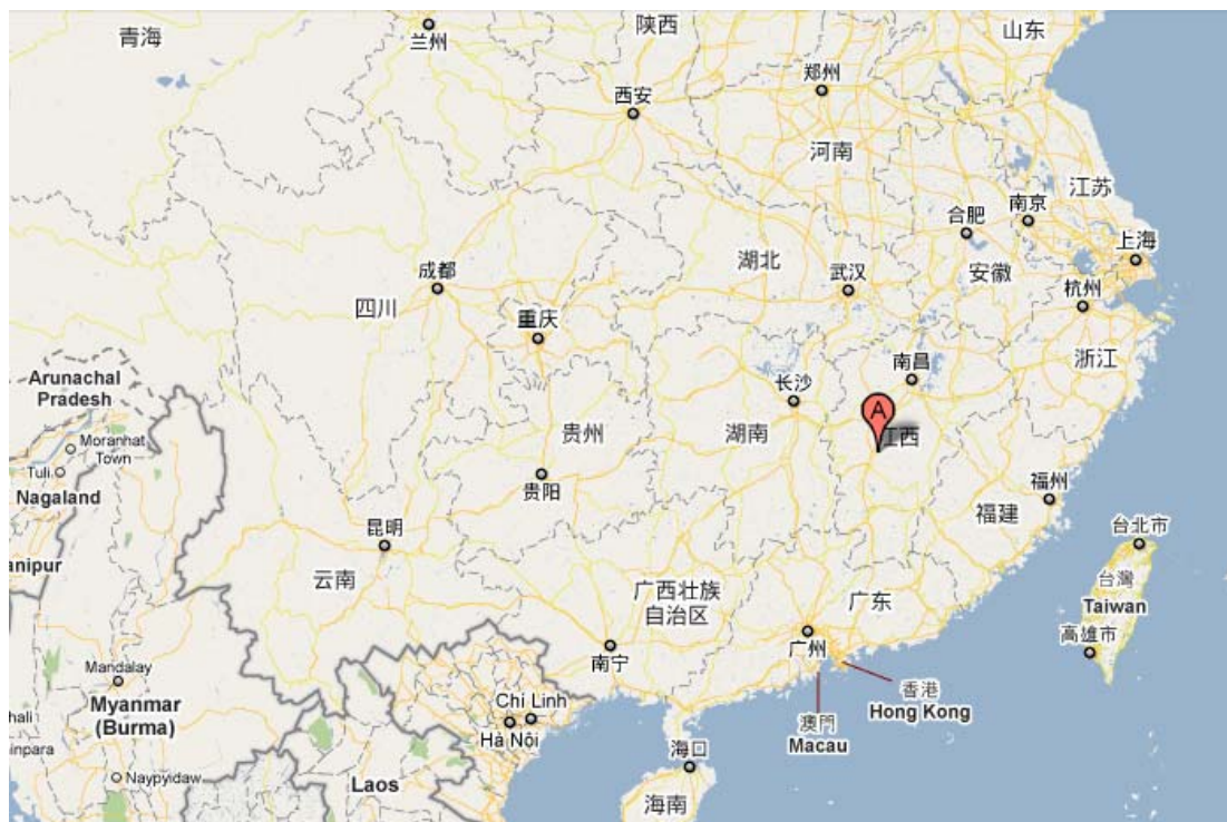
圖二：圖中 A 點所示為井岡山的位

井岡山位於江西省西南部，地處湘贛交界的羅霄山脈中段，其風景名勝區的面積是 261.43 平方公里，其風景區分為茨坪、龍潭、主峰、黃洋界、茅坪、龍市等 6 個景區、30 多處景點。2005 年 5 月，原井岡山市與原寧岡縣合併組建新的井岡山市。2005 年 7 月，成立井岡山管理局，主要負責井岡山旅遊和接待方面的事務。井岡山是中國革命的搖籃，在 1927 年 10 月，毛澤東、朱德、陳毅、彭德懷等無產階級革命家率領中國工農紅軍來到井岡山，創建中國第一個農村革命根據地，開辟了「以農村包圍城市，武裝奪取政權」的具有中國特色的革命道路，使井岡山贏得「天下第一山」的美譽 (謝, 2010)。