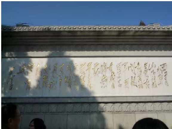
圖二：在黃洋界的革命詩歌

第二，除了紅色旅遊外，井崗山的綠色旅遊亦是井崗山旅遊的其中一個賣點，而且綠色旅遊與紅色旅遊相輔相承，互相輝映，令井崗山的旅遊更豐富、更吸引。井崗山被國家列為國家 4 A 級風景旅遊區，又被評為中國旅遊勝地四十佳之內，是中國的優秀旅遊景點之