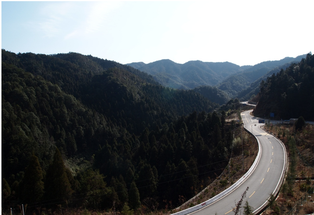
圖六：圖中所示為井岡山風景區兩旁的樹林

可再生資源。除了保護環境的政策外，井岡山政府亦做了不少工夫改善環境，以提升旅遊的環境承載量。由於連年的戰爭和近年的旅遊開發，特別是修建公路的過程中植被會受到一定程度上的破壞。但是，在井岡山政府大力復建植被的努力下，如今井岡山道路兩旁仍是青蔥一片，由此可見當地政府在保護環境所下的努力。