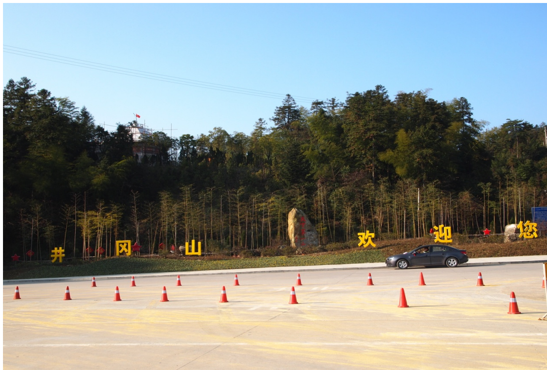
圖一：圖中所示為井岡山風景名勝區的入口

井岡山位於中華人民共和國江西省內，是中國重要的革命起義和國民教育的地方，其獨特的歷史背景促使當地政府大力開發旅遊事業，其「紅色旅遊」更是中國首先的開發者，具有獨特的研究價值。井岡山風景名勝區亦是中國首批國家重點風景名勝區，並以「紅綠相映型」的旅遊發展模式為主要發展策略，當中「紅綠相映型」的「紅」是指將特定的歷史與當前中國社會發展需要結合而產生的旅遊模式；而「綠」是指以生態旅遊為重點的旅遊模式，這種旅遊發展模式強調紅色旅遊區的開發建設中與綠色旅遊互相輝映，相得益彰，從而達至相輔相成的效果 (黃&宋, 2010)。然而，由於近年井岡山政府高速發展當地的旅遊業，因而為當地造成不少影響，本文將會從社會、經濟和環境三方面分析井岡山的旅遊業發展對當地造成的正面影響和負面的影響。