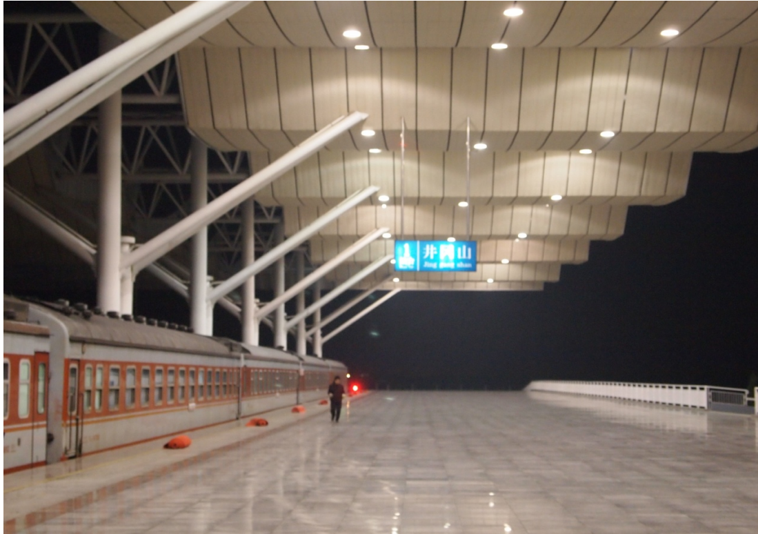
圖四：圖中所示為井岡山新建的火車站

但是，在旅遊業發展對社會益處的背後亦有不少壞處。由於不是所有井岡山的居民都有能力由農業轉投第三產業，所以可能加劇當地貧富懸殊的問題，並可能增加社會矛盾，影響社會穩定。因為一些年紀老邁和教育水平低的人士欠缺技能，所以他們的職業流動性十分低，即是他們可選擇的職業十分少，由於旅遊業是第三產業，其所要求的技能較高，所以他們不一定能夠在旅遊業找到工作，他們可能被迫繼續投入一些低增值和低工資的工作，在面對地區的經濟發展和通貨膨脹，他們的生活質素很有可能下降，儘管政府可能給予生活資助，但貧富懸殊的問題一定加以惡化，並增加社會矛盾。而且旅遊者對當地正常的社會秩序亦會造成不同程度的衝擊，由於大量外地的遊客到來，必會引起一系列的接待服務，並且會佔據當地人民的生活空間，分享當地的公共設施，使生活物品的供應緊張，影響當地居民正常的日常生活。